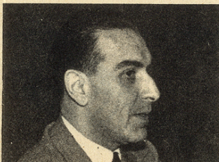
DINO DEL BO

DINO DEL BO - Capolista dei candidati per la Camera, è nato a Milano il 19 novembre 1916, è laureato in giurisprudenza e in scienze politiche. Durante il periodo della resistenza si dedicò alla organizzazione dei gruppi giovanili democristiani e dopo la liberazione divenne vice-segretario cittadino e provinciale, e consigliere nazionale della D.C. Nel '52 fu nominato sottosegretario al Lavoro, incarico che lasciò spontaneamente per dirigere la Segreteria nazionale Spes della D.C. di cui divenne, dopo il convegno di Roma, vice-segretario nazionale. Durante la seconda legislatura della Repubblica l'on. Del Bo è stato chiamato ancora al sottosegretariato al Lavoro durante i governi presieduti dall'on. De Gasperi e dall'on. Pella. Con il Governo Segni è stato nominato sottosegretario agli Esteri. Con la formazione del Ministero Zoli, venne infine nominato ministro ed incaricato dei rapporti fra Governo e Parlamento. L'on. Del Bo è libero docente in filosofia del diritto alla Università di Macerata ed è autore di molte pubblicazioni di carattere filosofico-giuridico e sociale.